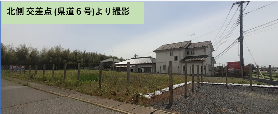
北側交差点(県道6号)より撮影